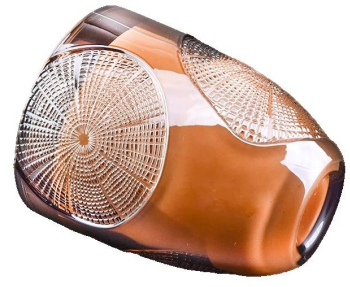
patrón de anillo morado tarro de vela de vidrio