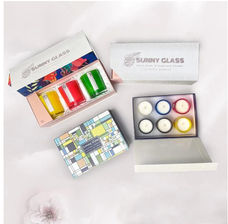
圖一 圖二 圖三