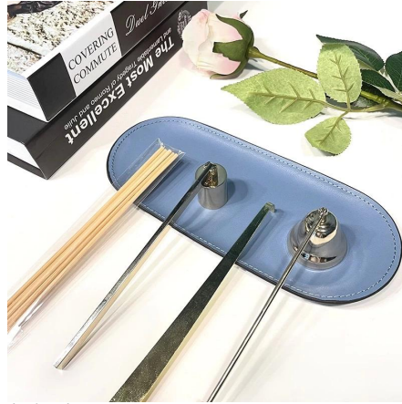
Pleje af stearialys