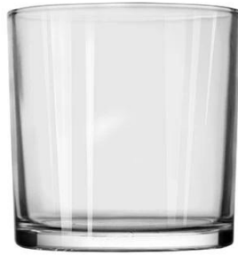
No. SGBZ120120H 29oz/968ml/700g H120 T120 B:112