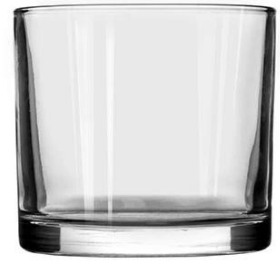
No. SGBZ9990H 12oz/480ml/445g H90 T99 B:95

Ihr Logo kann mit gestaltet werden Exklusives Label auf der Kerzengläser für Ihre Marke