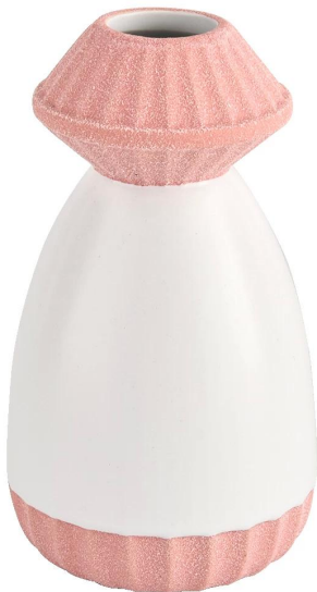
Rosafarbener Flaschenmund und -boden