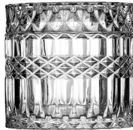
No. SGBZ8965 7oz/ 267ml/ 309g H65 T89 B90

Ihr Logo kann mit gestaltet werden Exklusives Label auf der Kerzenglas für Ihre Marke