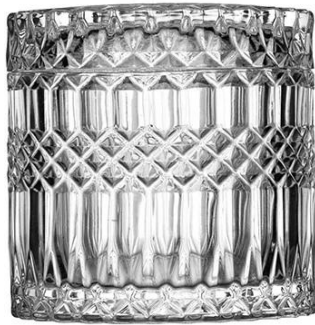
No. SGBZ10784 13.5oz/ 501ml/ 528g H84 T107 B106