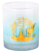
Handgefertigter Rehkitz-Aufkleber mit himmelblauem Farbverlauf