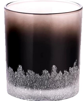
Von Hand applizierter schwarzer Farbverlauf