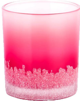
Von Hand applizierter roter Farbverlauf