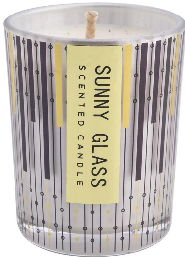
Lila Klavier mit gemustertem Papierglas