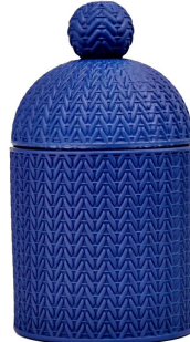
Blauer Kerzenhalter aus Glas mit Deckel