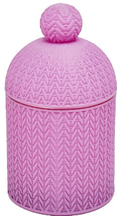
Lila Kerzenhalter aus Glas mit Deckel