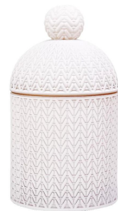
Kerzenhalter aus weißem Glas mit Deckel