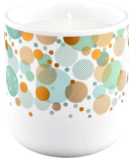
Mehrfarbiges kugelförmiges geometrisches Muster