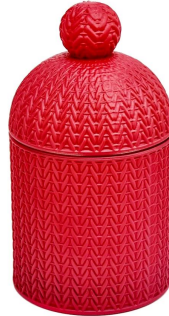
Kerzenhalter aus rotem Glas mit Deckel