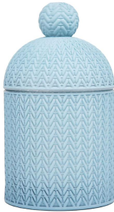
Hellblauer Kerzenhalter aus Glas mit Deckel