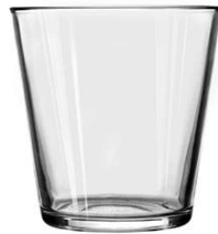
No. SGBZ108112V 16oz/ 600ml/ 371g H112 T108 B80