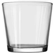
No. SGBZ135128V 30oz/ 1110ml/ 738g H128 T135 B106