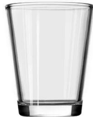
No. SGBZ101124V 14oz/ 513ml/ 475g H124 T101 B73