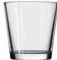
No. SGBZ100101V 12 oz/ 435ml/ 408g H101 T100 B76