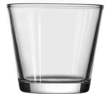
No. SGBZ9083V 8oz/ 288ml/ 251g H83 T90 B65