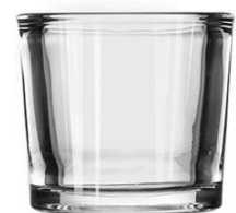
No. SGBZ6559HT 2oz/90ml/200g H59 T65 B59

Ihr Logo kann mit gestaltet werden Exklusives Label auf der Kerzengläser für Ihre Marke