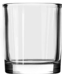
No. SGBZ8090HT 7oz/260ml/375g H90 T80 B75