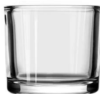
No. SGBZ9180HT 8oz/300ml/430g H80 T91 B86