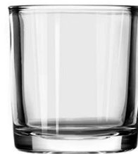
No. SGBZ7479HT 4.5oz/185ml/300g H79 T74 B69