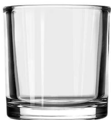
No. SGBZ100100HT 12oz/435ml/690g H100 T100 B93

Der Kerzengläser aus Glas ist transparent, Kerzengläser aus Glas hat eine gute Textur und ist leicht zu reinigen. Kerzengläser aus Glas Neben der Herstellung von Duftkerzen, Kerzengläser aus Glas Wenn einige kleine Gegenstände zu Hause schwer zu verstauen sind, wie z. B. Wattestäbchen, Make-up-Entferner-Baumwolle, Schmuck usw., ist dies der Fall Kerzenhalter aus Glas kann das Haus sauber und ordentlich halten.