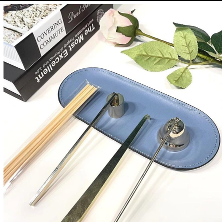
Cuidado de las velas