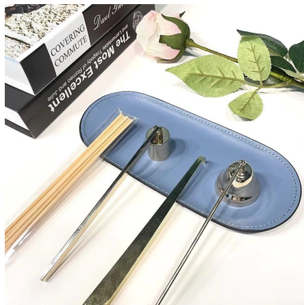
Cuidado de las velas