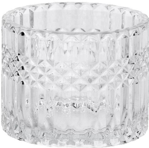
patrón de diamante tarros de cristal para velas