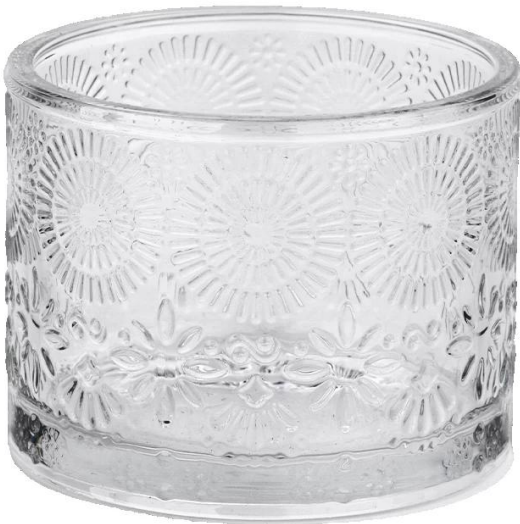
anillo solar tarros de cristal para velas