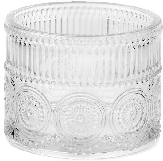
flor del sol tarros de cristal para velas