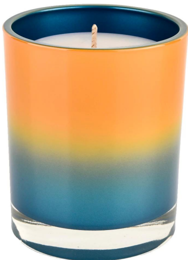
Naranja degradado azul