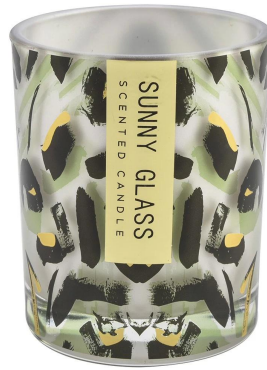
Patrón de tinta de punto de oro negro verde