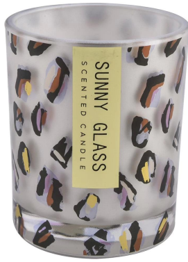
Patrón de tinta de punto de oro negro blanco