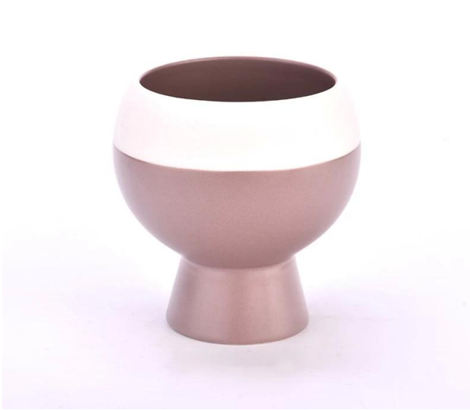
260ml cerámico tarros de velas