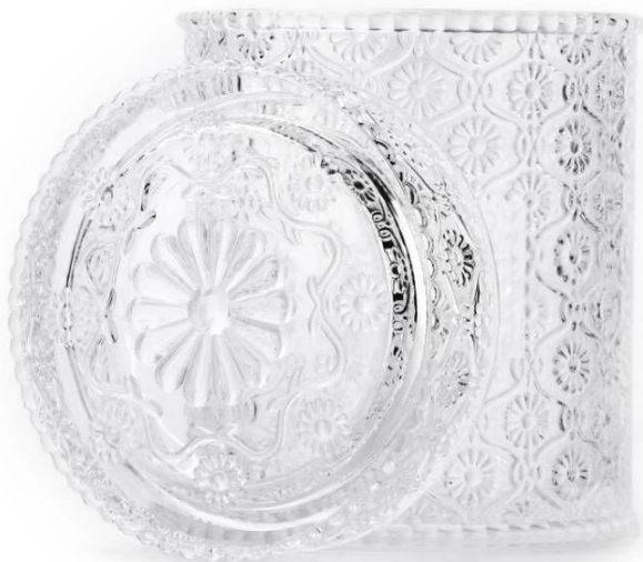
741ml con tapa tarros de velas de vidrio