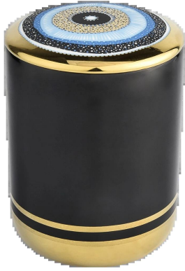
ojo azul portavelas de cerámica con tapa