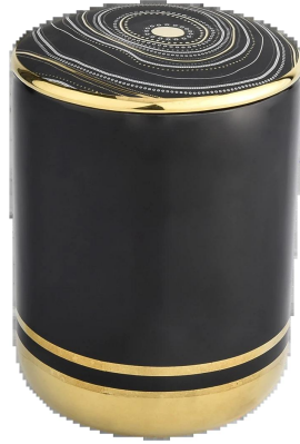
Patrón dorado arremolinado candelabros de cerámica con tapa