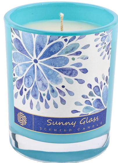
Tarro de vela de cristal verde