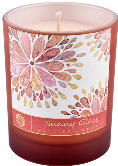
Tarro de vela de cristal rojo