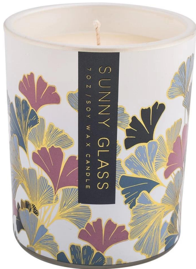
Patrón de hoja de ginkgo púrpura