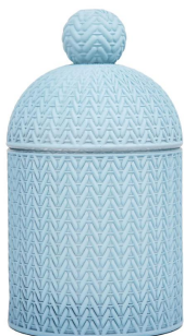
Portavelas de cristal azul claro con tapa