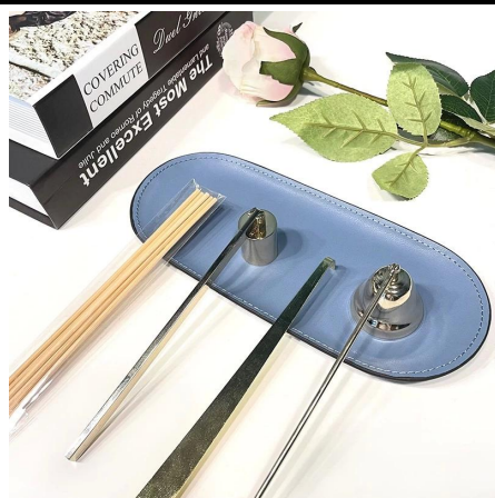
Cuidado de velas