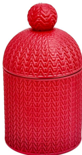
Portavelas de cristal rojo con tapa.