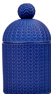
Portavelas de cristal azul con tapa.