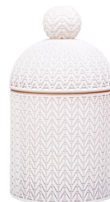
Portavelas de cristal blanco con tapa.