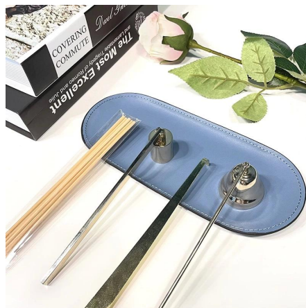
Cuidado de las velas