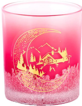
Vinilo navideño de casa hecho a mano con degradados rojos