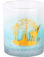
Vinilo cervatillo hecho a mano degradado azul cielo