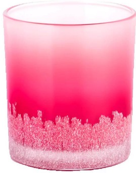
Degradado rojo aplicado a mano