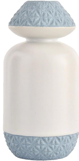
Motifs gravés sur le goulot et le fond de la bouteille bleue