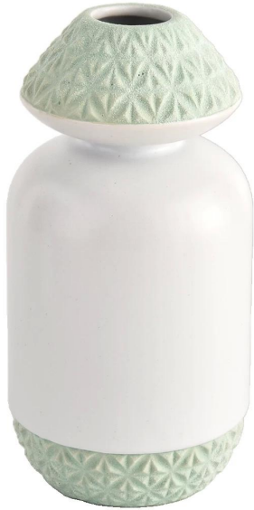
Motifs gravés sur le goulot et le fond de la bouteille verte