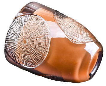
motif de bague violet pot de bougie en verre