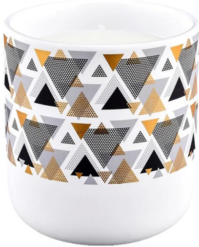
Motif géométrique de diamants multicolores