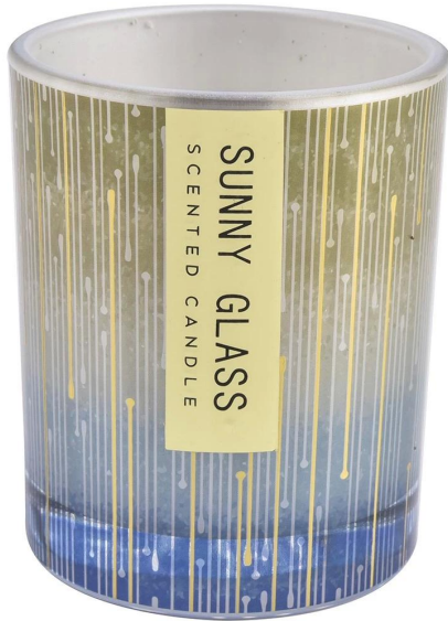
bande verticale bleue et jaune