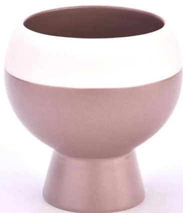
260 ml céramique pots de bougies