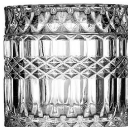
No. SGBZ8965 7oz/ 267ml/ 309g H65 T89 B90

Il tuo logo può essere progettato con etichetta esclusiva sul barattolo di candela per il tuo marchio