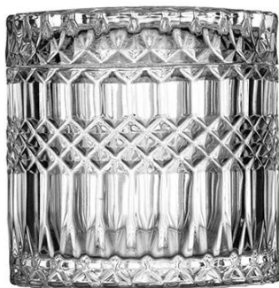
No. SGBZ10784 13.5oz/ 501ml/ 528g H84 T107 B106

di dimensioni e possiamo personalizzarli in base alle vostre esigenze