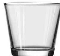
No. SGBZ9083V 8oz/ 288ml/ 251g H83 T90 B65