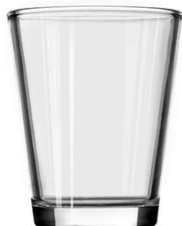
No. SGBZ101124V 14oz/ 513ml/ 475g H124 T101 B73