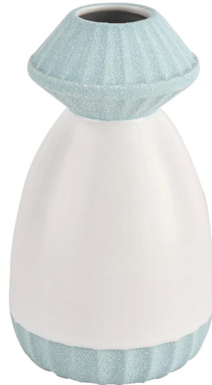
Bocca e fondo della bottiglia viola