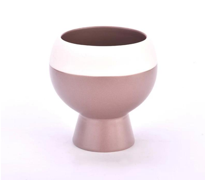
260 ml ceramic barattoli di candele