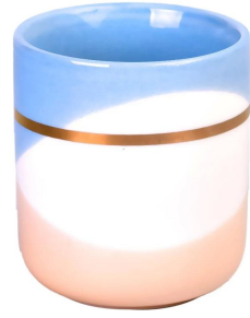
Modello ondulato blu rosa anello d'oro