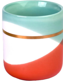
Modello ondulato blu porpora dell'anello di oro