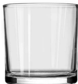
No. SGBZ100100H 14oz/575ml/420g H100 T100 B:95