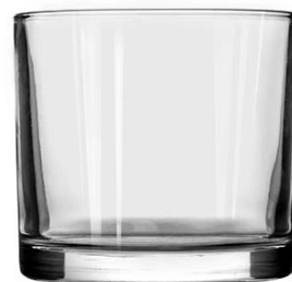
No. SGBZ9990H 12oz/480ml/445g H90 T99 B:95

Il tuo logo può essere progettato con etichetta esclusiva sul barattoli di candele per il tuo marchio