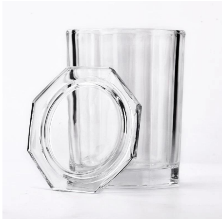
1096ml me te taupoki ipu rama karaihe