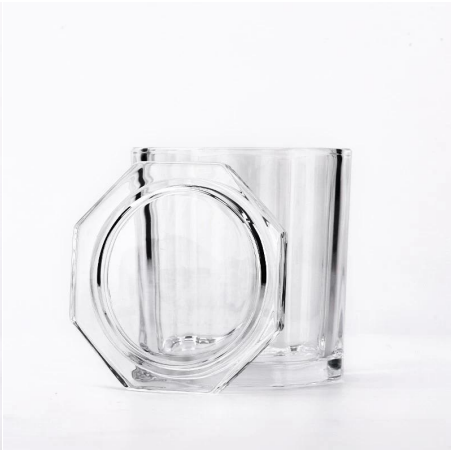
691ml me te taupoki ipu rama karaihe