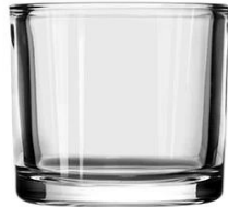
No. SGBZ9180HT 8oz/300ml/430g H80 T91 B86