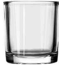
No. SGBZ7479HT 4.5oz/185ml/300g H79 T74 B69