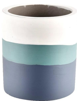
Ma, ma, puru