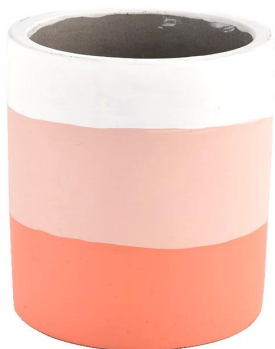
Ma, mawhero, karaka