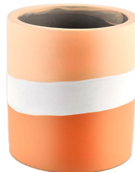
Awhe kowhai kanapa karaka ma