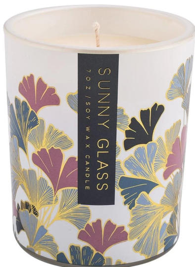
Te tauira rau gingko papura