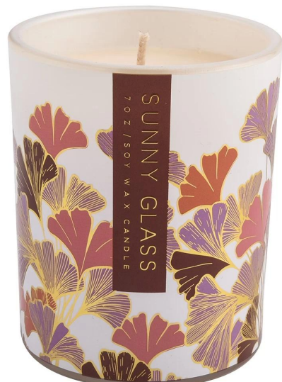
Te tauira rau gingko kakariki