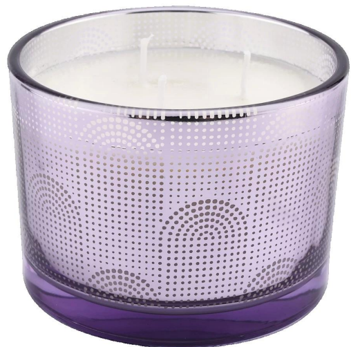
Te tauira puawai papura