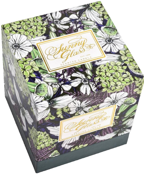
Tauira matomato pouri