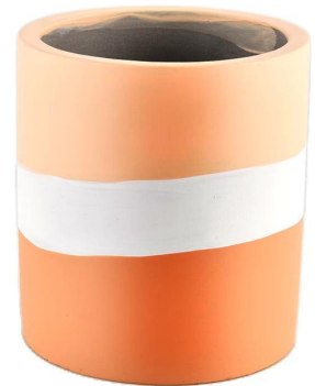
Awhe kowhai kanapa karaka ma