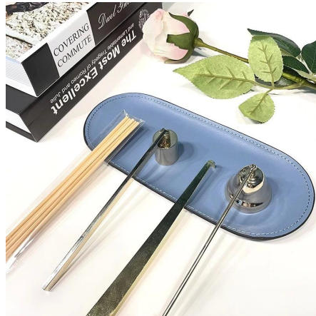
Pangangalaga sa Kandila