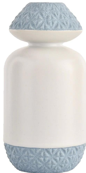
Синяя горловина и дно бутылки с гравировкой.