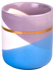
Золотое кольцо фиолетово-синий волнистый узор