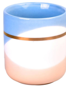
Золотое кольцо синий оранжевый волнистый узор