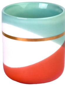
Золотое кольцо голубой красный волнистый узор