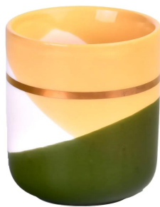
Золотое кольцо желто-зеленый волнистый узор