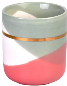
Золотое кольцо зеленый красный волнистый узор