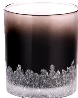
Ручная аппликация чёрного градиента