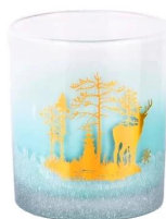
Самодельная папелая наклейка с небсно-голубым градиентом