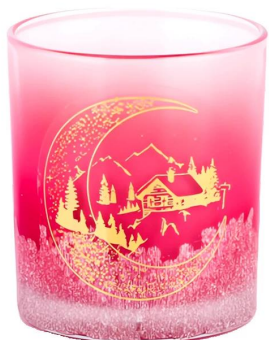
Рождественские наклейки на дом ручной работы с красными градиентами